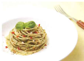
イタリアンふりかけのペペロンチーノ風パスタ

材料(1人分) パスタ・・・80g イタリアンふりかけ オリーブオイル・・・大さじ2