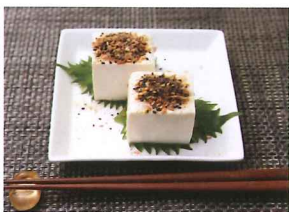
胡麻みそふりかけの冷や奴

材料(1人分) 木綿豆腐・・・1/2丁 胡麻油・・・大さじ1/2 胡麻みそふりかけ・・・大さじ1