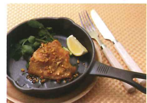
インドカレーふりかけのチキンソテー

材料(1人分) 鶏もも肉・・・100g ココナッツオイル又はお好みの油・・・大さじ1 塩、胡椒・・・少々 インドカレーふりかけ・・・大さじ1